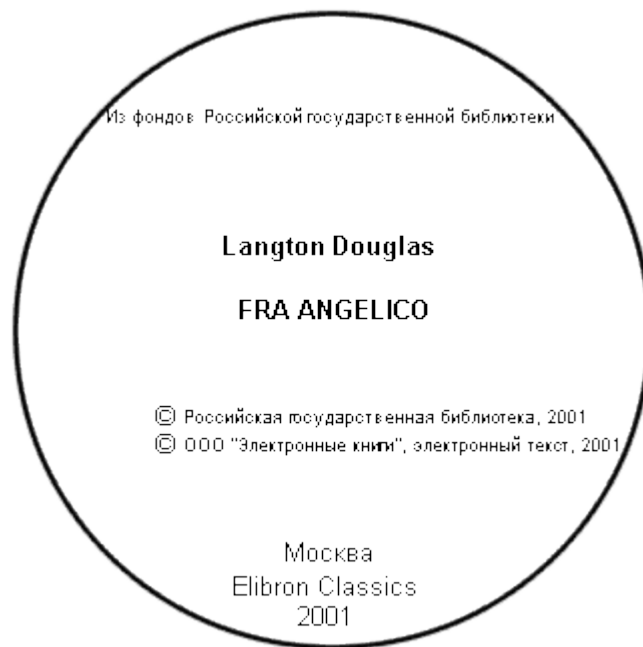
Лицевая сторона первичной упаковки