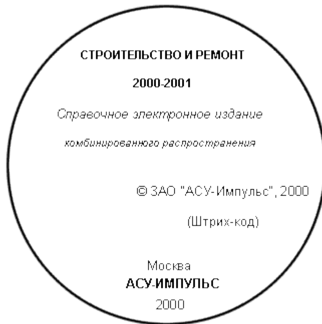
Лицевая сторона первичной упаковки